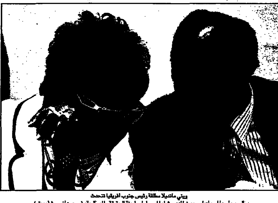
ويني مانديلا مستجوبة من قبل لجنة الحقيقة والمصالحة في جنوب أفريقيا